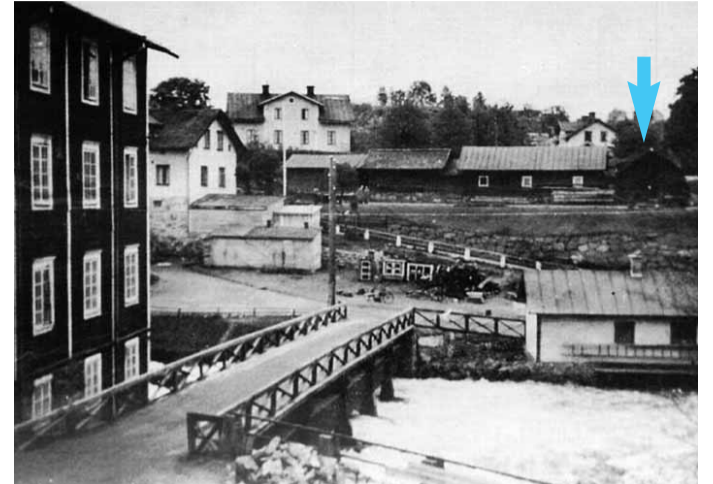
Fotograf: Birgit Pehrsson, 1940-tal

... men det har inte alltid varit ett café. Byggnaden har av tidigare slussvakter använts som uthus, dass och ladugård. En ko, hushållsgris och några höns samt betesrätt i omkringliggande område hörde till slussvaktarens privilegier.