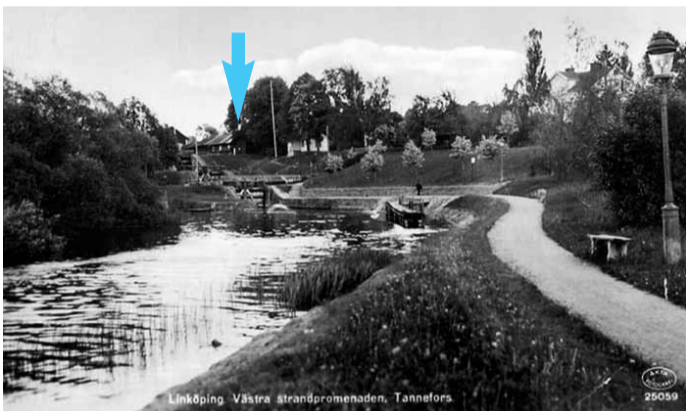
Okänd fotograf, 1940-tal