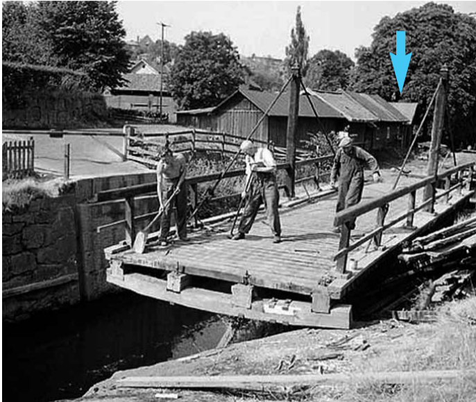
Fotograf: Arne Gustafsson, 1950/60-tal

Valborgsmässoafton 1996 öppnade portarna på Café Tannefors slussar för första gången. med åren har caféet utvecklats och blivit mycket uppskattat av såväl linköpingsbor som besökare från när och fjärran. 2007 tilldelades caféet utmärkelsen "Linköpings mysigaste uteservering", framröstat av Östgöta Correspondentens läsare.