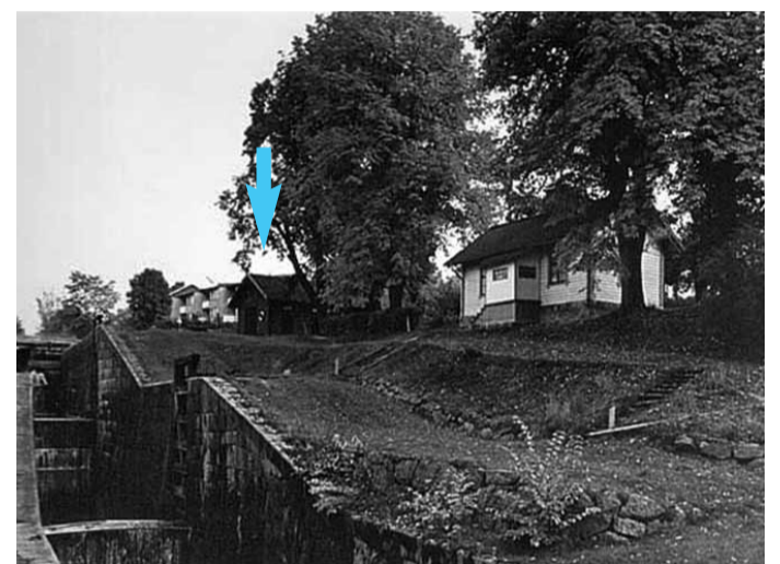
Fotograf: Per-Olov Axelsson, 1970